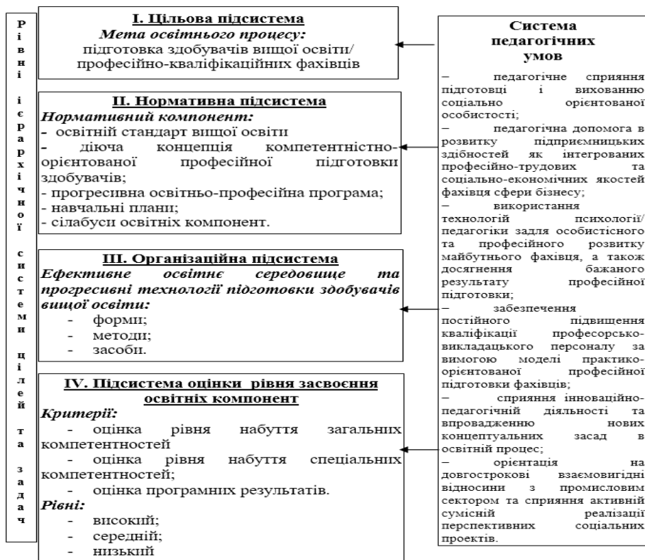
Рисунок 1 – Складові інноваційно-орієнтованого освітнього процесу професійної практико-орієнтованої підготовки фахівців

Інноваційна освітня політика має бути спрямована на реалізацію інноваційних освітніх програм та забезпечення ринку праці сучасним поколінням економічно і інноваційно обізнаних фахівців, рівень професійних компетенцій яких би задовольнив всі вищезгадані зацікавлені сторони. При цьому розвиток такого типу пов'язаний не тільки з управлінням новачками, а й розумінням необхідності постійної роботи по створенню бажаних умов для таких змін та посиленню адаптаційних якостей.