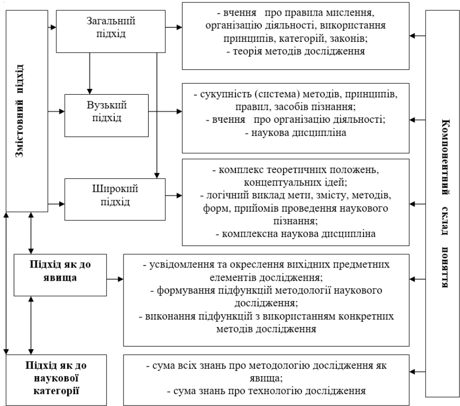
Рисунок 1. Взаємозв'язок підходів до розуміння дефініції «методологія наукового дослідження» та їх компонентний склад