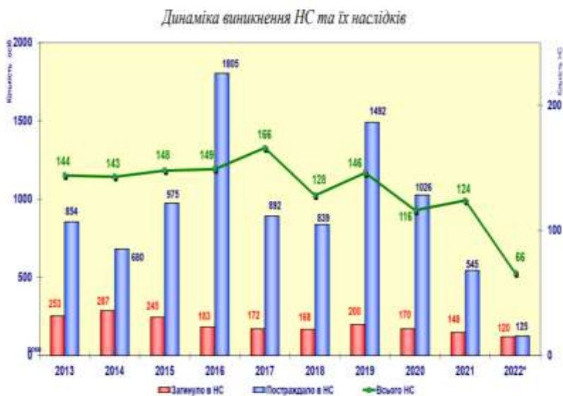
Кількісні показники класифікованих НС, які сталися на території України у 2013 – 2022 рр.